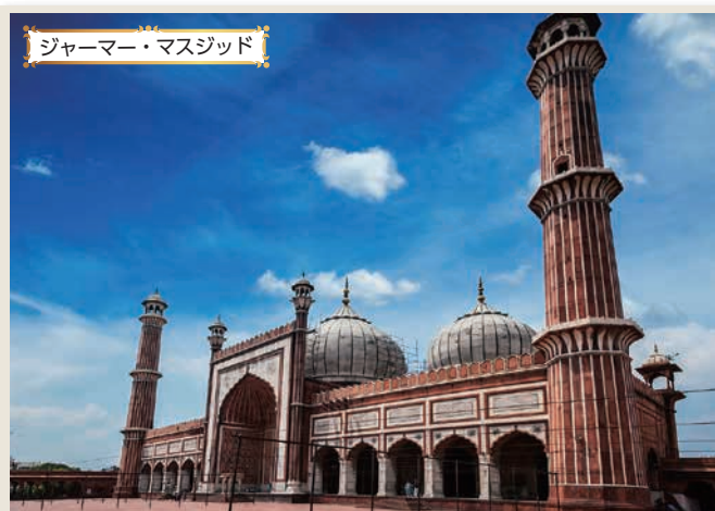
ジャマール・マスジッド