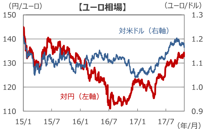
(注) データは2015年1月1日～2017年10月26日。 (出所) Bloomberg L.P.のデータを基に三井住友アセットマネジメント作成

■当資料は、情報提供を目的として、三井住友アセットマネジメントが作成したものです。特定の投資信託、生命保険、株式、債券等の売買を推奨・勧誘するものではありません。■当資料に基づいて取られた投資行動の結果については、当社は責任を負いません。■当資料の内容は作成基準日現在のものであり、将来予告なく変更されることがあります。■当資料に市場環境等についてのデータ・分析等が含まれる場合、それらは過去の実績及び将来の予想であり、今後の市場環境等を保証するものではありません。■当資料は当社が信頼性が高いと判断した情報等に基づき作成しておりますが、その正確性・完全性を保証するものではありません。■当資料にインデックス・統計資料等が記載される場合、それらの知的所有権その他の一切の権利は、その発行者および許諾者に帰属します。■当資料に掲載されている写真がある場合、写真はイメージであり、本文とは関係ない場合があります。