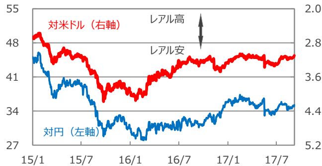
【ブラジルレアル】 (円/レアル) (レアル/米ドル)